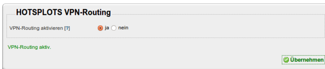
Abbildung 3: Einfaches Aktivieren des VPN-Routing per Mausklick im Webinterface

Die Behörden werden mittels HOTSPLOTS VPN-Routing direkt zu HOTSPLOTS geleitet, ohne dass der Hotspot-Betreiber involviert wird. Dort erhalten die Ermittler dann die Informationen, die für die Aufklärung nötig und im Rahmen der gesetzlichen Vorgaben gespeichert sind. An der Funktion und Konfiguration des WLAN-Hotspots ändert sich nichts, sodass Hotspot-Betreiber und -Nutzer den Einsatz der VPN-Server kaum wahrnehmen.