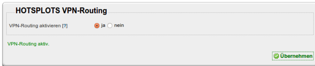
Abbildung 3: Einfaches Aktivieren des VPN-Routing per Mausklick im Webinterface

gaben gespeichert sind. An der Funktion und Konfiguration des WLAN-Hotspots ändert sich nichts, sodass Hotspot-Betreiber und -Nutzer den Einsatz der VPN-Server kaum wahrnehmen.